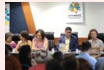
Representantes do setor participaram do debate na Câmara

representantes de entidades sindicais, o evento reuniu representantes da Superintendência Regional do Trabalho e Emprego de Pernambuco, do Departamento de Estudos Inter-sindical de Estatísticas e Estudos Socioeconômicos (DIESE), da Comissão Municipal de Emprego e Renda do Recife e da Secretaria de Desenvolvimento Sustentável e Meio Ambiente.