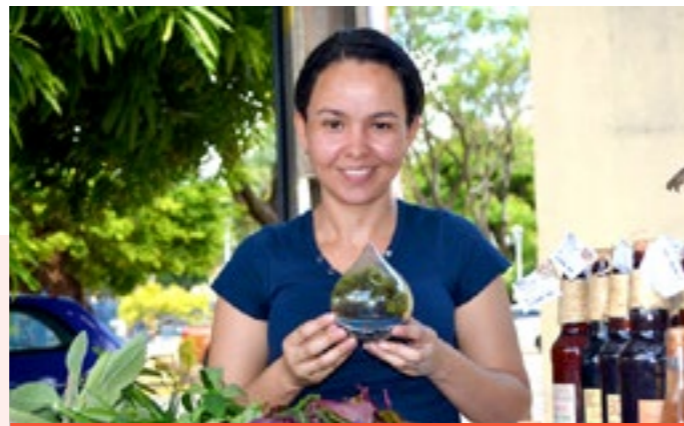
Empreendedores econômicos solidários dos Escoes expuseram os seus artesanatos, alimentos e produtos agroecológicos

EMENDA PARLAMENTAR - No último dia 21 de novembro, com aprovação do plenário da Câmara Municipal do Recife, o vereador Rinaldo Junior (PRB) destinou R$ 110 mil, através de emenda parlamentar, na Lei Orçamentária Anual (LOA), para o fomento à economia popular e solidária na capital pernambucana. O recurso será destinado para a Secretaria de Desenvolvimento Sustentável e Meio Ambiente (SDSMA). Na emenda modificativa, o parlamentar indicou que o recurso seja utilizado na implantação dos Espaços de Comercialização da Economia Solidária (ESCOES).